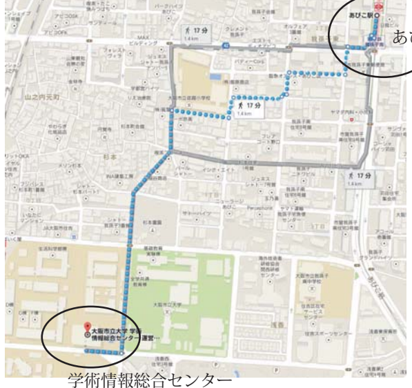
学術情報総合センター